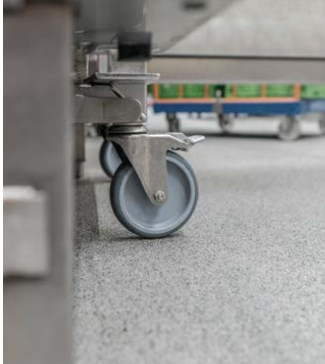
Starke Basis für schwere Aufgaben – belastbar, fugenlos, hygienisch.