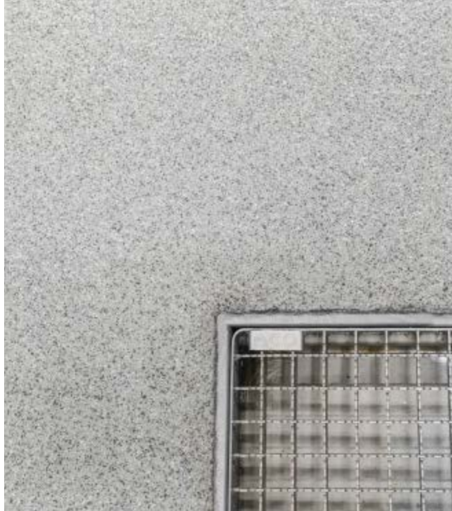
Wo Wasser hin muss – sicherer Bodenanschluss an Entwässerungsrinnen.