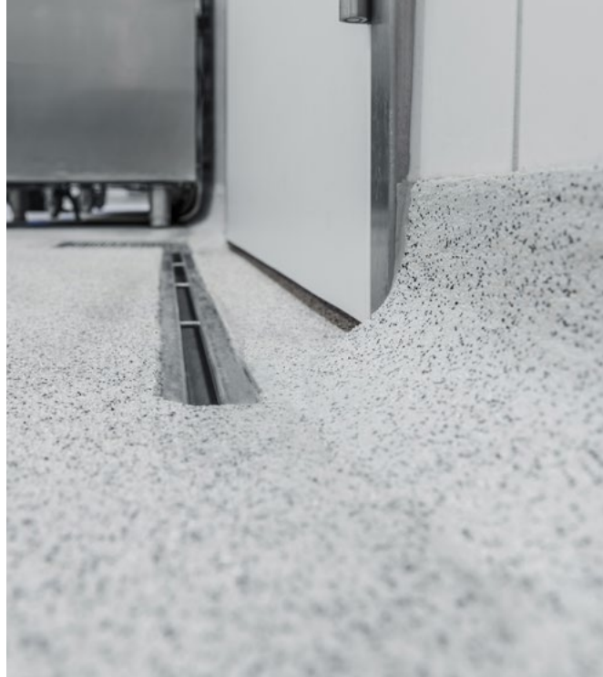
Umlaufende Hohlkehlen als Wandabschluss für hohe Hygienestandards.