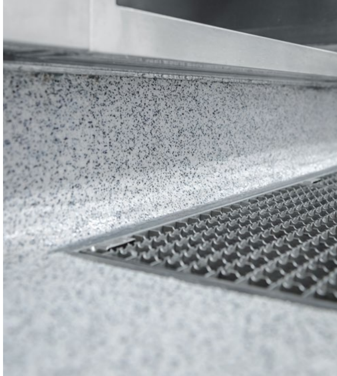
Fugenlose Anarbeitung an Abläufe für eine gute Reinigungsfähigkeit.