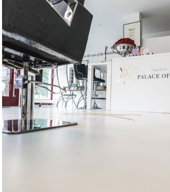
Pflegeleichter, hygienischer Fußbodenbelag dank fugenloser Oberfläche.