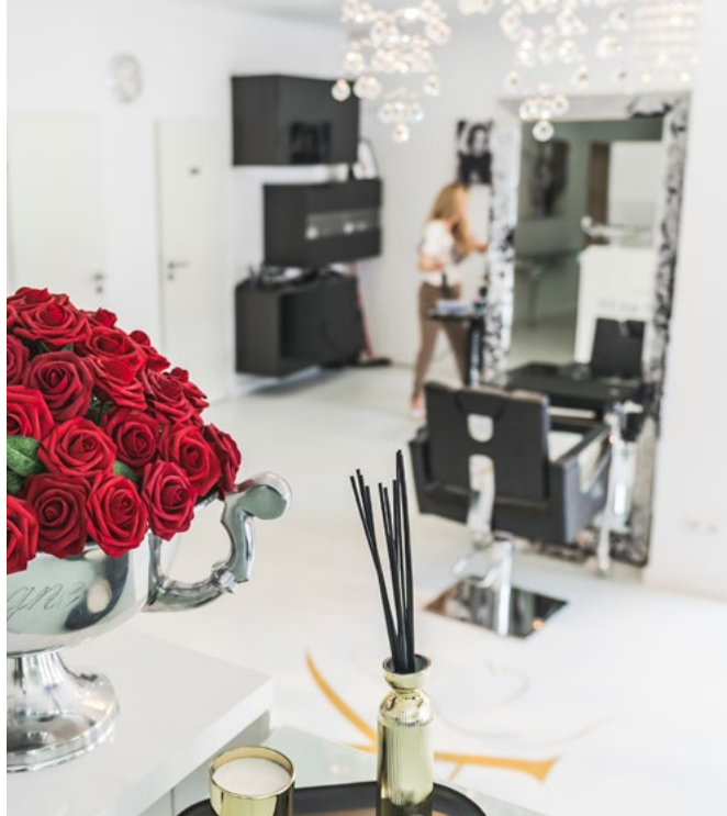
Logo-Schriftzug mit überschüssig eingestreuten partiColor®-Glitterpartikeln.