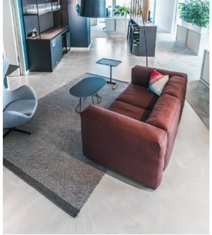
Pflegeleicht, fugenlos, modern - ein Boden für höchste optische Ansprüche.