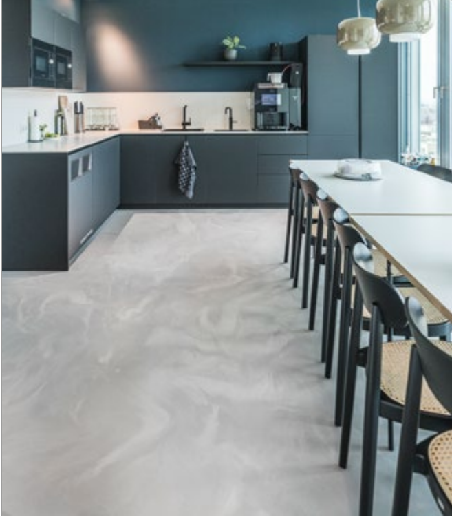
Einzigartiger Look in Wischtechnik, für Räume die Eindruck hinterlassen.