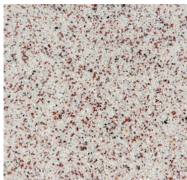
CQS-4605 | 0,3/0,8 mm Base* gris clair CQS-4655 | 0,7/1,2 mm