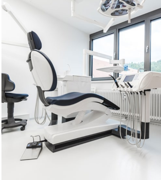
Installation sans joints pour une grande propreté et un nettoyage facile.