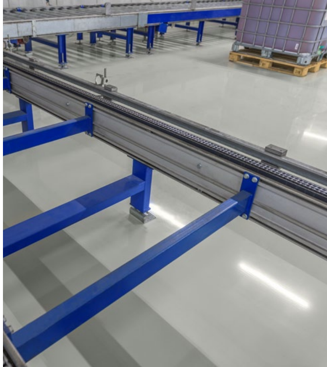
Peut résister à des substances dangereuses pour l'eau.