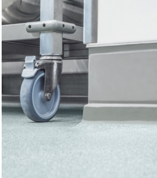
Hohlkehlen für eine verbesserte Reinigungsfähigkeit des Fußbodens.