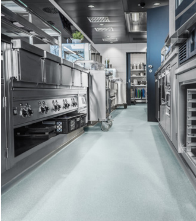
Rutschhemmender Abstreubelag für einen sicheren Stand.