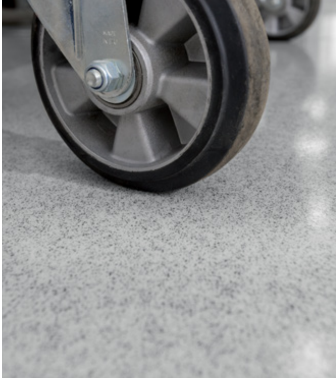
Optische Aufwertung durch die Einbindung von Colorquarzsand.