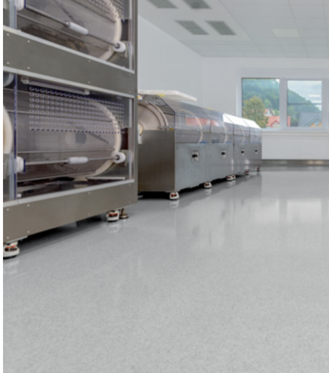
Robuster Industrieboden mit gleichzeitig hohem hygienischen Anspruch.