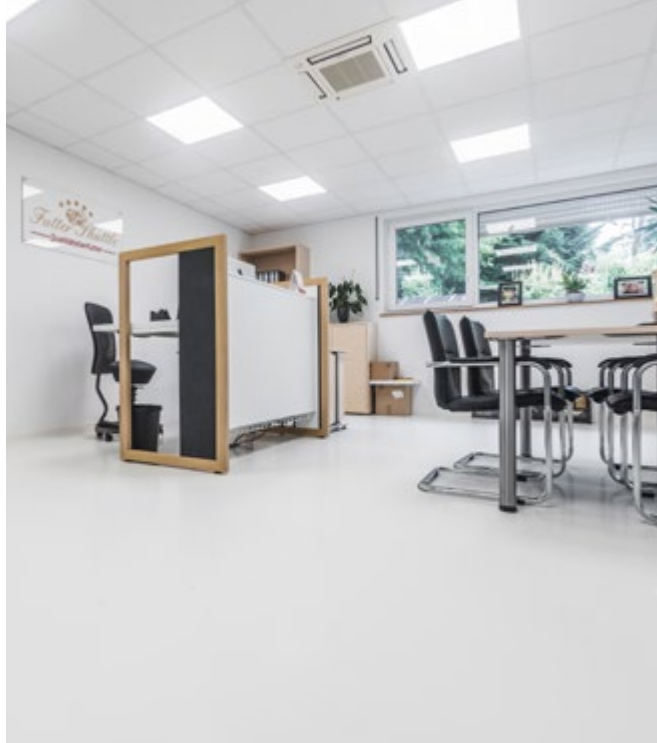
Edles, cleanes Bodendesign – dauerhaft lichtstabil.