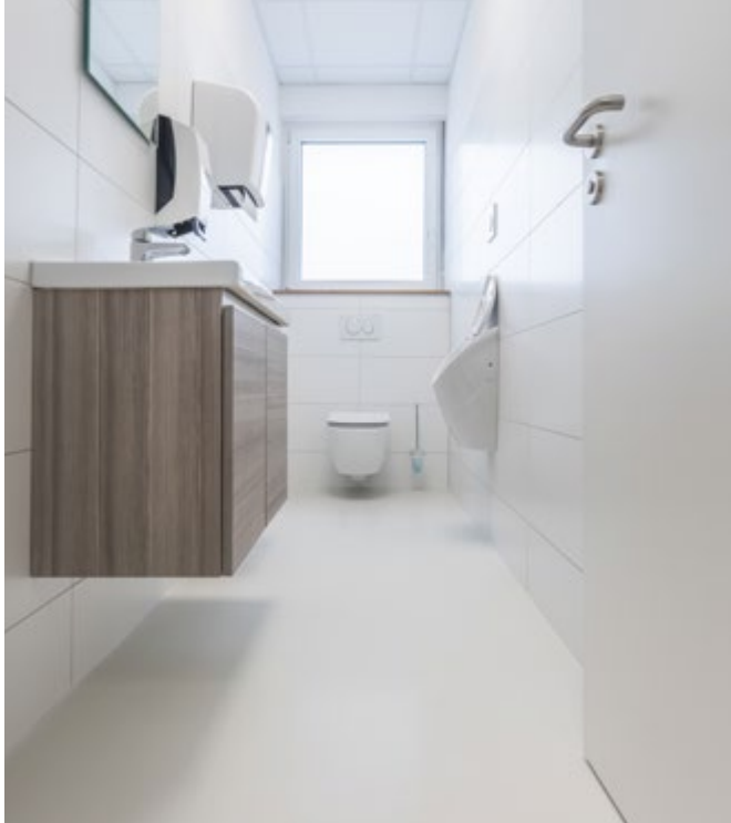
Fugenlose Ausführung für hohe Sauberkeit und gute Reinigungsfähigkeit.