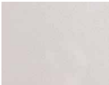
partiColor®-Metalize Silver - ZG1021-92 Basis* - RAL 7035