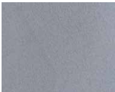
partiColor®-Metalize Silver - ZG1021-92 Basis* - RAL 7015