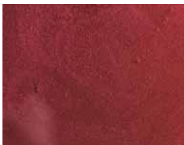
partiColor®-Metalize Red - ZG1026-92 Basis* - RAL 7015