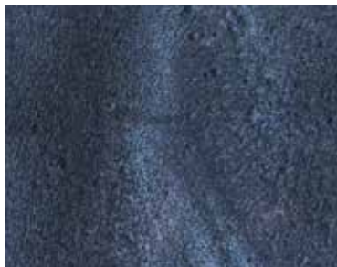
partiColor®-Metalize Pepper - ZG1023-92 Basis* - RAL 7015