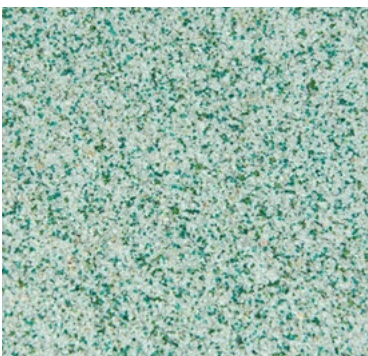
CQS-4607 - Basis* hellgrau