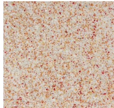
CQS-4606 - Basis* weiß