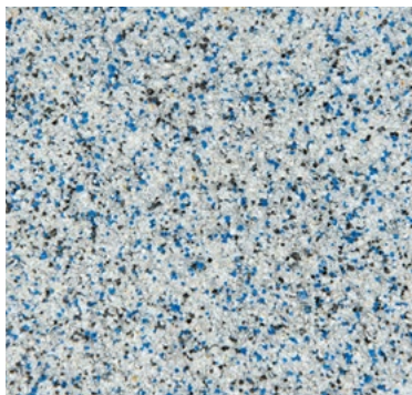
CQS-4703 AS - Basis* hellgrau