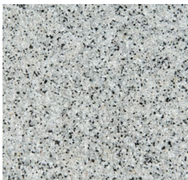
CQS-4701 AS - Basis* hellgrau

Ableitfähige Colorsandmischungen für abgestreute, dekorative und leitfähige RX-Beläge. Gut abstreubare Mischungen mit kontrolliertem Verbrauch. Schleifbar für Beläge mit Rutschhemmstufen R11 und R10.