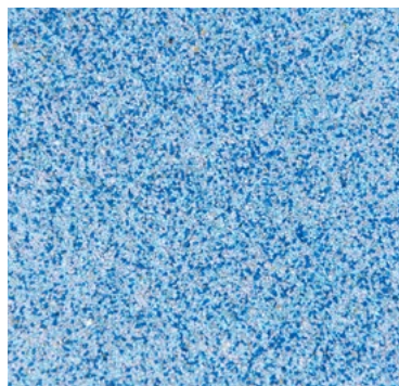
CQS-4608 - Basis* blau