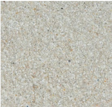
CQS-4601 - Basis* weiß

Farbstabile Colorsandmischungen für dekorative, abgestreute RX-Beläge. Gut streubare Mischungen mit kontrolliertem Verbrauch, schleifbar für Beläge mit Rutschhemmstufen R11 und R10.