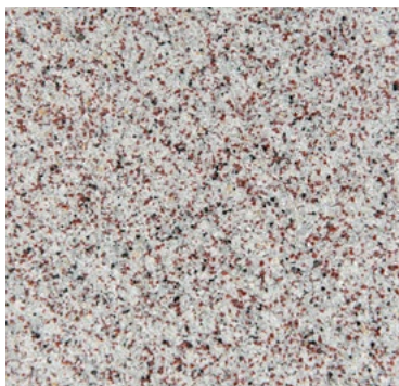
CQS-4704 AS - Basis* hellgrau