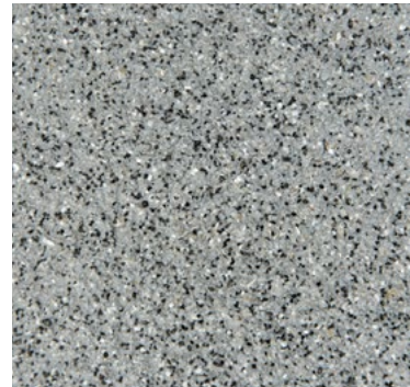
CQS-4603 - Basis* mittelgrau