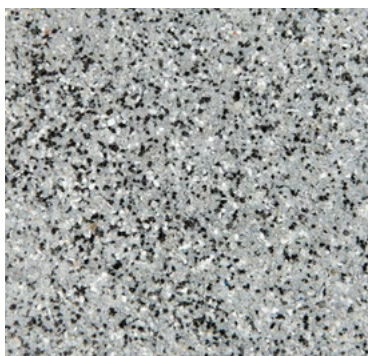
CQS-4702 AS - Basis* mittelgrau