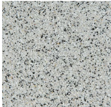
CQS-4602 - Basis* hellgrau